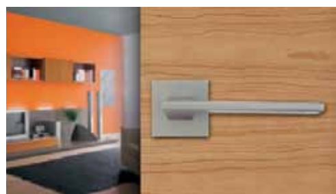
Minimalistický design kování TERRY. Základním materiál je mosaz doplněná o titanový povrch s vysokou mechanickou odolností. K pořízení od 3013 Kč včetně DPH. www.kliky-mt.cz

Reverzní zárubně jsou určeny pro dveře, které tvoří jednu rovinu se stěnou, ale otevírají se na opačnou stranu a je jedno, zda jsou pravé nebo levé. A kam tento nový typ otevírání je vhodné použít? Do chodbiček, kde často bojujeme s místem. SAPELI