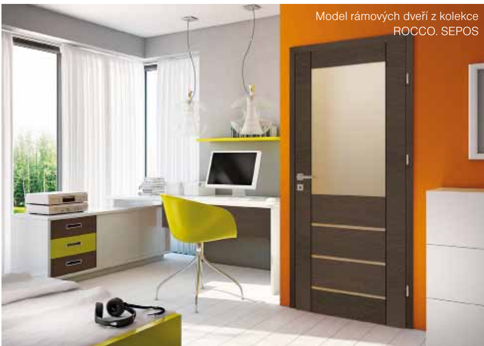
Model rámových dveří z kolekce ROCCO. SEPOS