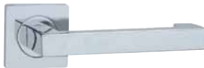
COBRA - QUBIC-S.jpg