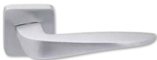
Aria P 710 HR, novinka roku 2014, povrchová úprava matný chrom, moderní quatro linie, cena od 2209 Kč. Více na www.twin.cz

Vnitřní dveře se opět těší zasloužené pozornosti. Kromě toho, že plní své klasické poslání, mohou se stát důležitým designovaným prvkem interiéru a lze je dokonale sladit s ostatním vybavením a celkovým stylem.