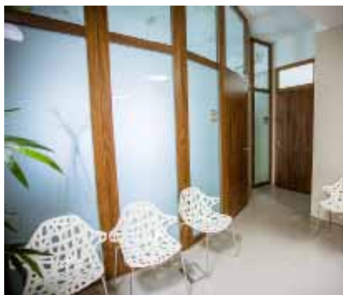
Ořechové dveře s dřevěnou rámovou zárubní osazené v líci zdiva. QL-INTERIER