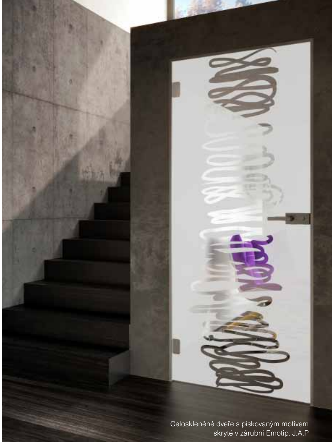
Celoskleněné dveře s pískovaným motivem skryté v zárubni Emotip. J.A.P

Všichni milovníci technickým materiálů ocení originální designový povrch v podobě rezavého plechu. Tento unikátní povrch můžete na dveřích mít v extrémně odolném HPL laminátu. K pořízení od 5312 Kč včetně DPH. SAPELI